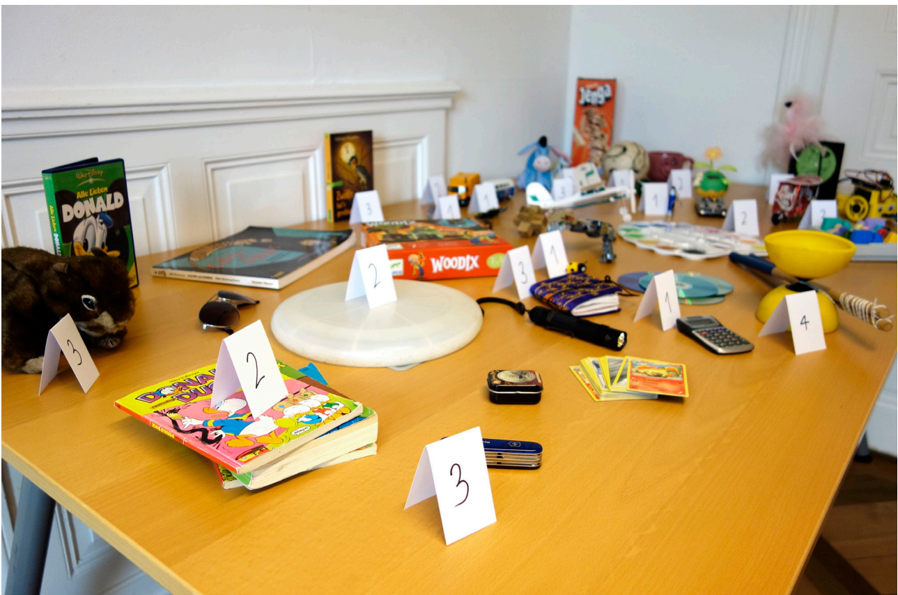
Tauschgegenstände mit Tauschpunkten